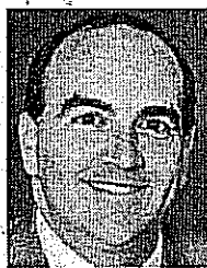
Por Greg Siskind y Gilda Bollwerk Siskind & Susser